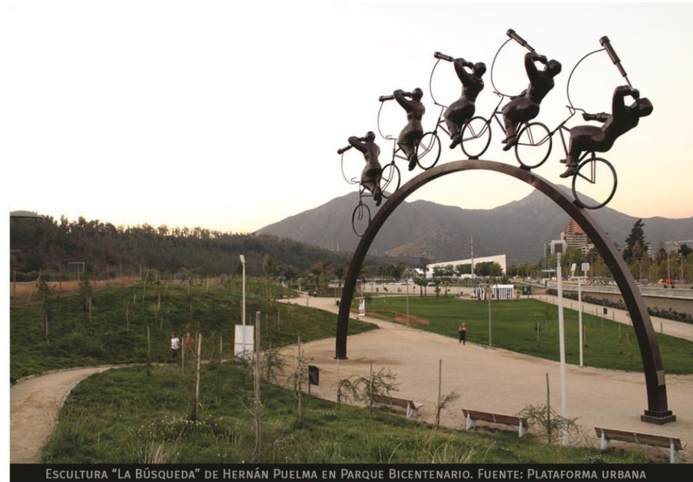
ESCU LTURA "LA BÚSQUEDA" DE HERNÁN PUELMA EN PARQUE BICENTENARIO. FUENTE: PLATAFORMA URBANA

CIRCUITO CULTURAL DE VITACURA: ARTE, CONSUMO Y DESARROLLO