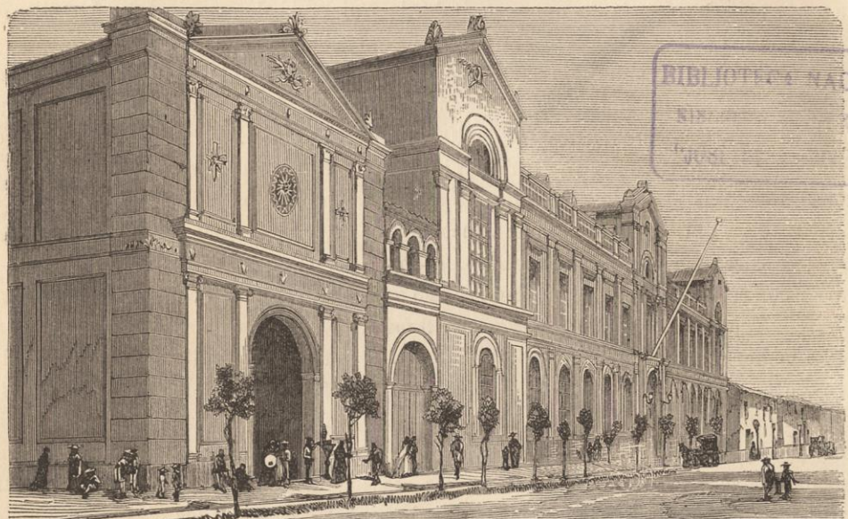
PALACIO DE LA UNIVERSIDAD E IGLESIA DE SAN DIEGO, RECARDO TORNERO, 1872.