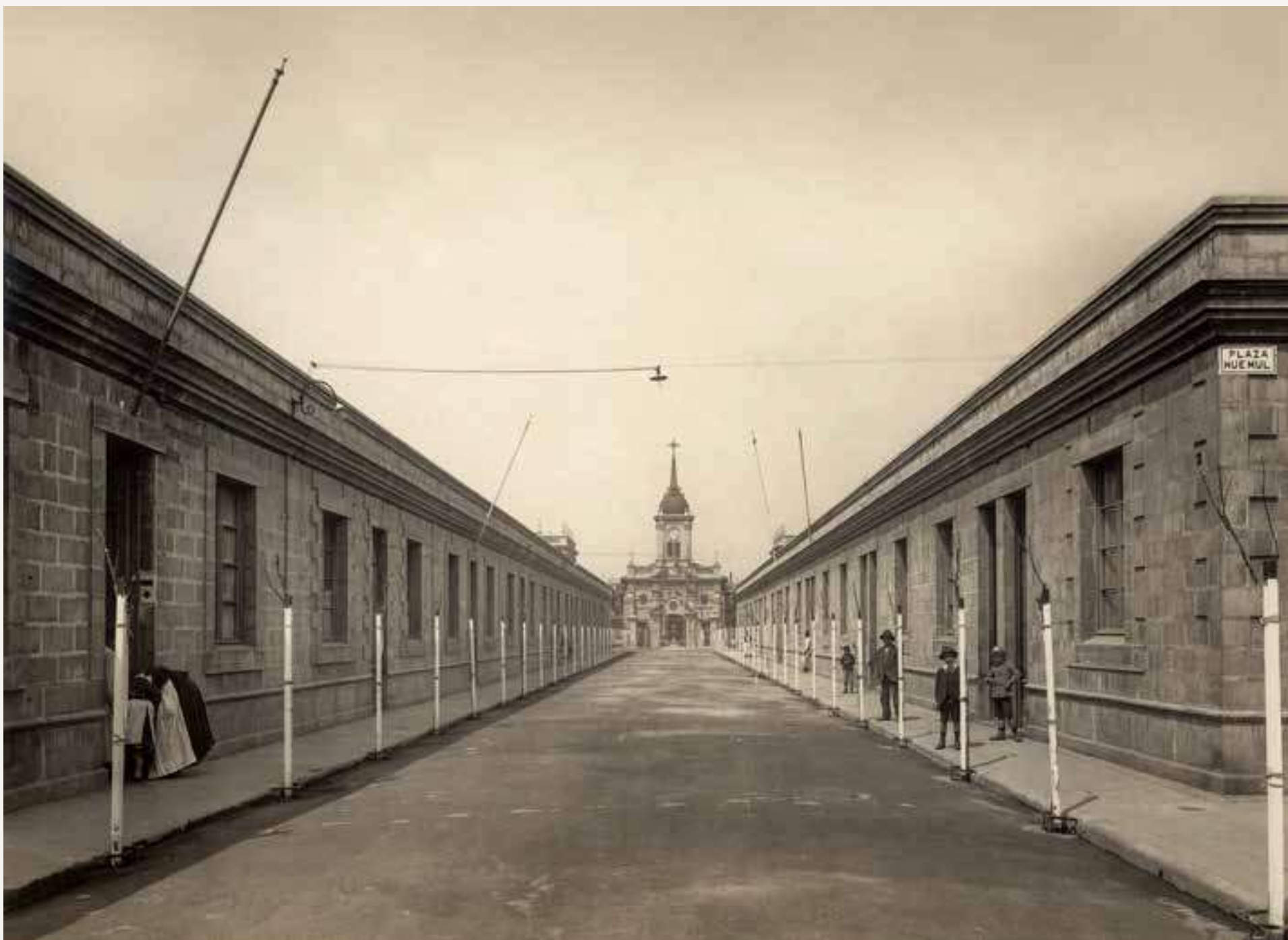
Fotografías del Barrio Huemul I. La primera corresponde al año 1914. La segunda es una fotografía actual extraída del Consejo de Monumentos Nacionales.

Por incentivo directo o indirecto de la Ley de Habitaciones Obreras se construyeron emblemáticas poblaciones, especialmente en Santiago, destacando por ejemplo el barrio Huemul I y la población San Luis en Independencia. La primera se encuentra ubicada al sur de la comuna de Santiago, en un sector con una fuerte característica industrial y fue un ejemplo de población obrera considerando, además de las viviendas, espacios educativos, de salud y recreación. La segunda es la población San Luis, conocidas también como las casas de yeso, ubicadas en la comuna de Independencia. Se trata de un pasaje con 12 viviendas con antejardín que tienen la características de ser construidas con paneles de yeso, este material permitió un menor costo y tiempo en su construcción.